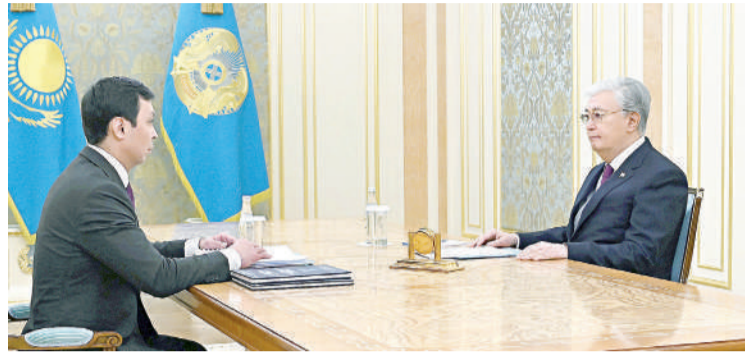
Президент Қасым-Жомарт Тоқаев Сыбайлас жемқорлыққа қарсы іс-қимыл агенттігінің төрағасы Асхат Жұмағалиды қабылдады.

Президентке Сыбайлас жемқорлыққа қарсы іс-қимыл агенттігінің елімізде қабылдаған шаралары туралы есеп берілді. Қасым-Жомарт Тоқаевқа Антикор қызметінің биылғы