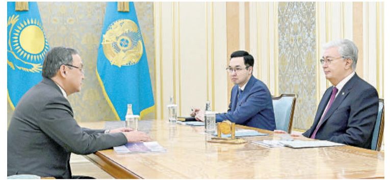
Мемлекет басшысы Қасым-Жомарт Тоқаев Ұлттық ғылым академиясының президенті Ақылбек Күршібаевты қабылдады.

Президентке Ұлттық ғылым академиясының бытырғы атқарған қызметінің негізгі нәтижелері жөнінде баяндалды. Мемлекет басшысына 2024 жылы отандық ғылымның жағдайын бағамдап, саланы дамытудың басым бағыттарын айқындау мақсатында жүргізілген кешенді жұмыс жөнінде мәлімет берілді. Ақылбек Күршібаевтың айтуынша, былтыр бағдарламалық-нысаналы қаржыландыру көзделген 113 ғылыми-техникалық тапсырмаға сараптама жүргізілген, сондай-ақ 3 интеграцияланған пәнаралық ғылыми-техникалық бағдарлама әзірленген. Қасым-Жомарт Тоқаев отандық ғылымның әлеуетін арттыру үшін одан әрі жүйелі шаралар