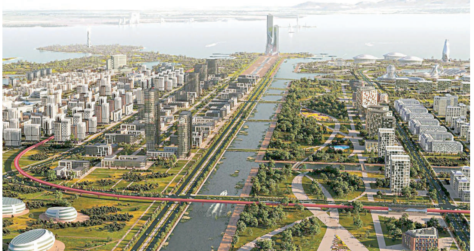
Алатау қаласының құрылғанына жылдан асты. Мемлекет басшысы Қасым-Жомарт Тоқаевтың Жарлығымен еңсе тіктеген шаһардың бұл күнде Бас жоспары бекітіліп, шекарасы нақтыланды.