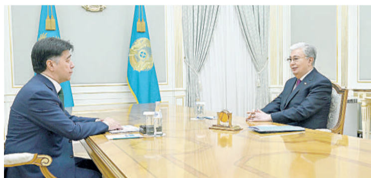
Президент Қасым-Жомарт Тоқаев Астана мемлекеттік қызмет хабы Басқарушы комитетінің төрағасы Әлихан Байменовті қабылдады.

Өңгімелесу барысында әлемдегі мемлекеттік басқарудың даму үрдістері мен доктриналары талқыланды. Астана мемлекеттік қызмет хабының жетекшісі мемлекеттік басқару саласының тиімділігін арттыру, сыбайлас жемқорлықтың алдын алу және жергілікті атқарушы биліктің құзыреттерін кеңейту мәселелері жөнінде ой-пікірін жеткізді. Сонымен қатар Әлихан Байменов V Дүниежүзілік