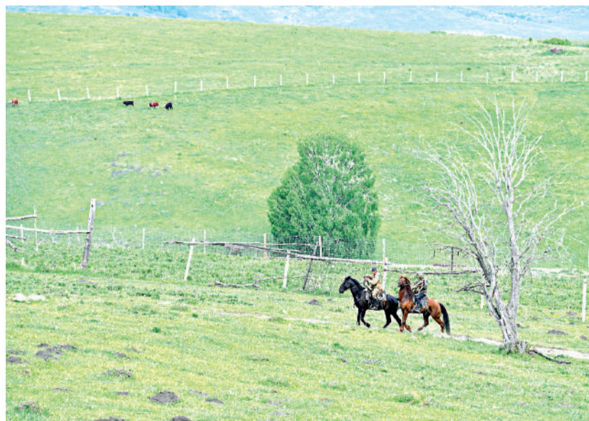
Суретті түсірген Еран ОМАР, «EQ»

Берел – тоғыз жолдың торабында жатқан туристік әлеуеті мол ауыл. Өйгілі Рахман қайнары, Берел қорық-музейі, Мұзтау,